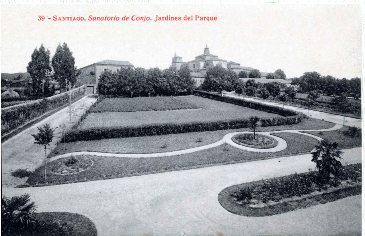
JARDINES DE CONXO