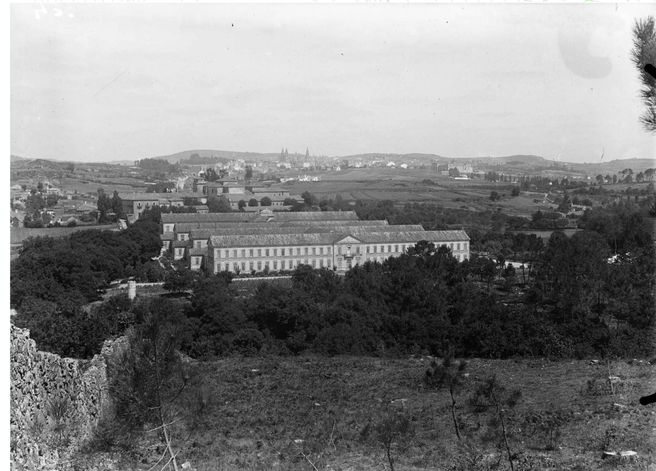
HOSPITAL PSIQUIÁTRICO DE CONXO. VISTA HACIA SANTIAGO