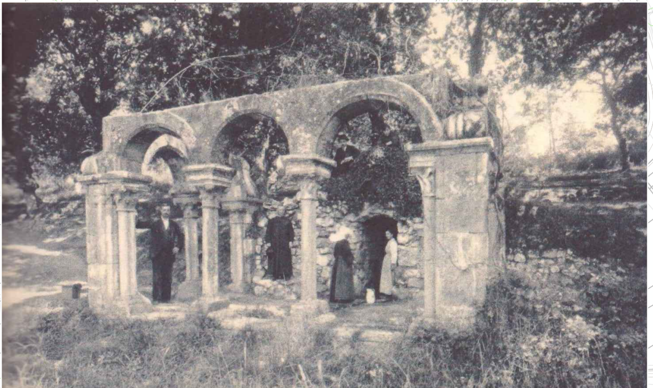
FUENTE DE LA VIRGEN